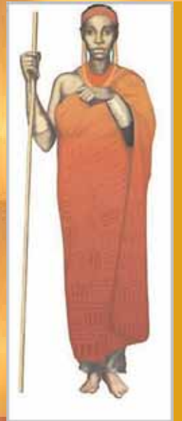
Mâma Mvita Kimpa 1684-1706