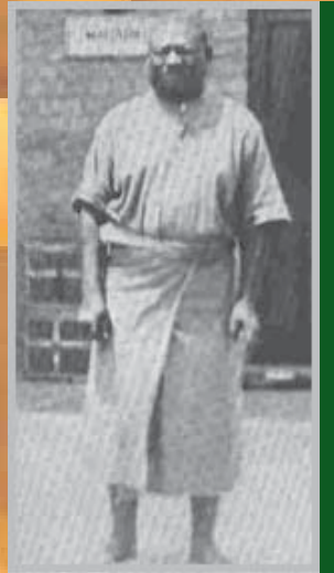
Tâta Simon Kimbangu 1889-1951